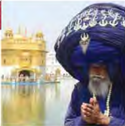
Сикх перед Золотим храмом

Унаслідок цього штурму і бійні сикхський тероризм став ще більш екстремістським. По-друге, поліцейські і військовослужбовці сикхи почали або звільнятися, або просто дезертирувати з індійської армії. Крім цього, акцією відплати за штурм