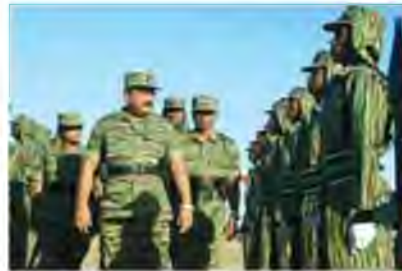
Лідер ТЗТІ Велупіллаї Прамбакаран оглядає війська; серед солдатів «тигрів» — жінки

Уряду Шрі-Ланки вдалося розгромити «тигрів» у 2009 р. Під час війни між ТЗТІ й урядом Шрі-Ланки загинули близько 70 тис. осіб, понад 800 тис. стали біженцями. Урядовим військам здалися 11 664 активісти «тигрів», зокрема 500 дітей-солдатів.