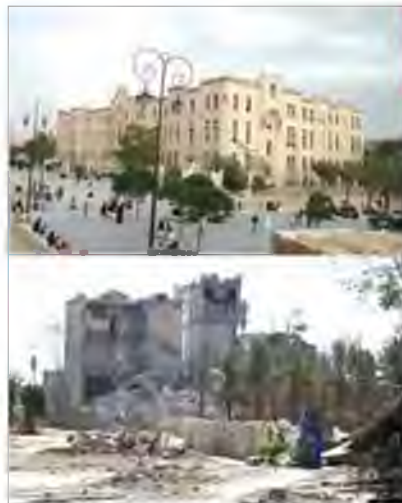
Алеппо до війни і тепер

У Сирії відбувається гуманітарна катастрофа : близько 900 тис. жителів оточених урядовими військами міст потерпають від нестачі води, їжі, медикаментів. Увага світової громадськості прикута також до Алеппо , по-варварськи зруйнованого російськими військовими літаками. Біженцями