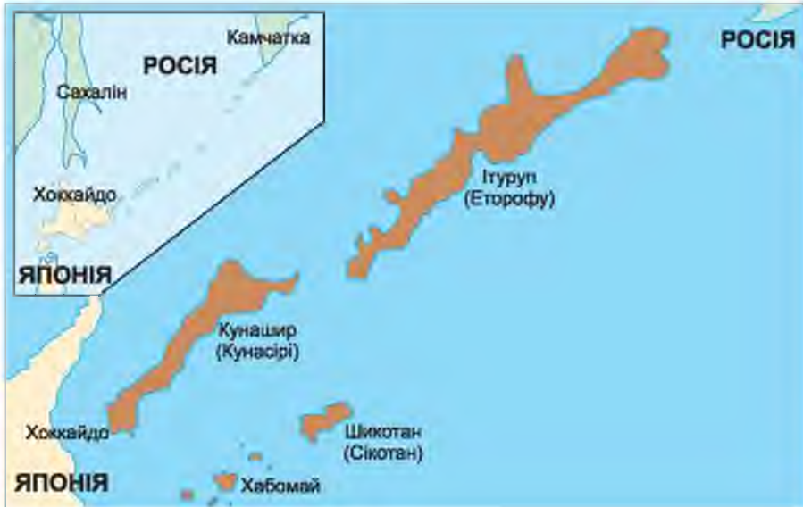
Карта спірних територій

Важливим напрямом зовнішньої політики Японії є боротьба за повернення «північних територій» — островів Ітуруп, Кунашир, Шикотан і Хабомай , якими володіє Росія. Незгода між Японією і Росією щодо приналежності цих південних островів Курильської гряди виникла в результаті їх окупації радянськими військами в 1945 р. під час Другої світової війни. Японія не визнає російського суверенітету над островами і вважає їх своїми. Зокрема, під час підписання Сан-Франциського мирного договору 1951 р. із союзниками Японія відмовилася від Курил і Південного Сахаліну, однак не визнала радянського суверенітету над чотирма островами південних Курил. СРСР, правонаступником якого є Росія, Сан-Франциський договір не підписав, вважаючи Курили своїми на підставі домовленостей союзників у ході Другої світової війни. У 1956 р. СРСР і Японія підписали декларацію про завершення воєнних дій, однак мирний договір так і не було підписано.