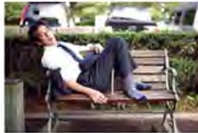
Інемурі (з япон. — бути і спати) — денний сон на роботі, у громадському транспорті й інших публічних місцях не лише не забороняється, а й заохочується суспільством, адже інемурі демонструє сумлінне ставлення до роботи