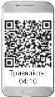
Аварія на «Фукусімі». 24 канал, 01.08.2013 р.

Зовнішньополітичний курс Японії в другій половині ХХ ст. визначався стратегічним співробітництвом із США . США одержали пра-