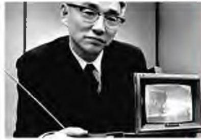
Засновник Sony Акіо Моріта на презентації портативного кольорового телевізора компанії в м. Нью-Йорку влітку 1967 р.

Японське «економічне диво» зробили можливим самі японці. Дисциплінованість, працьовитість і ретельність завжди були найважливішими рисами японського національного характеру. Протягом післявоєнних років японці працювали значно більше й інтенсивніше, ніж робітники в інших країнах світу, і за досить скромну винагороду. Японська мова збагатилася неологізмом «каросі» — «смерть від перевтоми на роботі».