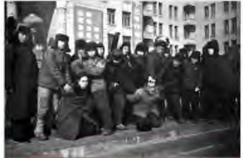
Публічне приниження «ворогів народу» під час «культурної революції»