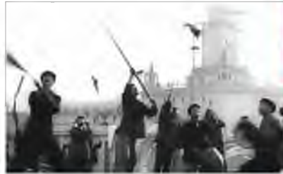
Кампанія проти «горобців-шкідників»

Рік потому врожаї справді стали ліпшими. Але не забарилися й наслідки відсутності горобців — гусениці та саранча, які зжирали все, що посходило. Раніше такого не траплялося, бо горобці харчувалися шкідниками. Унаслідок нашестя сарани врожаї зменшилися настільки, що в країні настав голод, який забрав близько 30 млн людських життів.