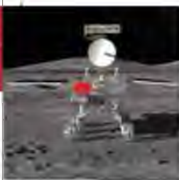
Китайський місяцехід на Місяці, січень 2019 р.

З січня 2019 р. китайський космічний корабель «Чан'е-4» став першим апаратом, який здійснив м'яку посадку на зворотному боці Місяця, якого ніколи не видно із Землі. Згодом світ побачив перші знімки зворотного боку супутника Землі. Місяцехід Jade Rabbit розпочав дослідження цієї території. Китай оголосив, що планує збудувати на супутнику Землі свою базу, а також відправити апарат на Марс до 2020 р. і на орбіту Юпітера до 2029 р.