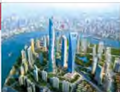
Сучасне китайське місто Шанхай

В Україні, наприклад, продаж товарів «made in China» становить близько 80 % всього вітчизняного ринку одягу та взуття.